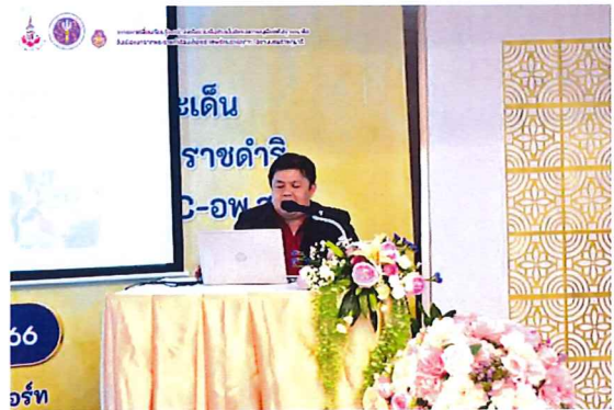
ภาพกิจกรรมที่ ๓ ตัวแทนจากมหาวิทยาลัยนเรศวร แม่ข่ายเครือข่าย ภาคเหนือตอนล่าง นำเสนอผลงานของเครือข่ายภาคเหนือตอนล่าง