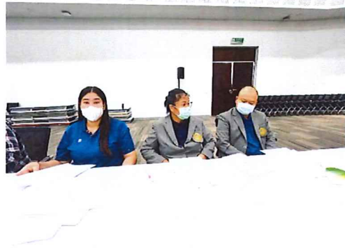
ภาพกิจกรรมที่ ๒ เครือข่ายม.ราชภัฏอุตรดิตถ์