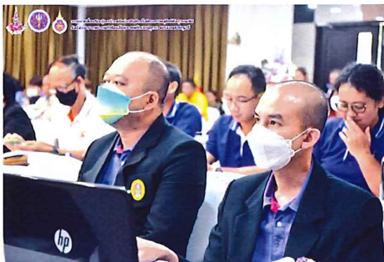
ภาพกิจกรรมที่ ๓ ตัวแทนจากมหาวิทยาลัยราชภัฏอุตรดิตถ์ เครือข่ายภาคเหนือตอนล่าง