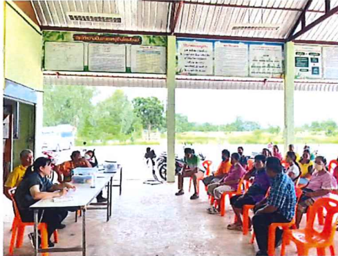
ภาพกิจกรรมที่ ๔.๑ ซีแจงวัดอุประสงค์การคำหาโจทย์วิจัย