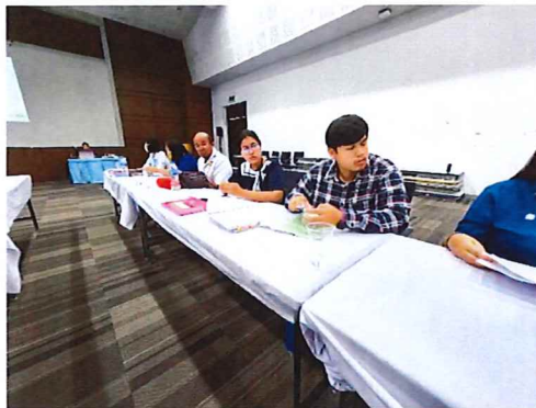
ภาพกิจกรรมที่ ๒ เครือข่ายม.ราชมงคลล้านนา พิษณุโลก