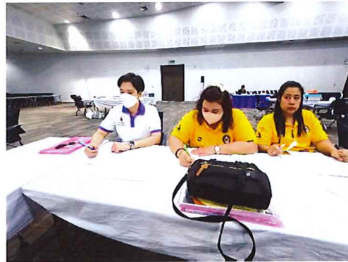
ภาพกิจกรรมที่ ๒ เครือข่ายม.ราชภัฏกำแพงเพชร