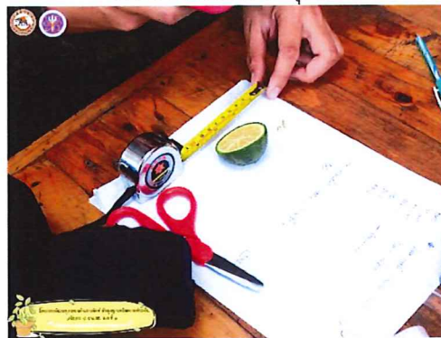
ภาพกิจกรรมที่ ๑ สัมซ่า