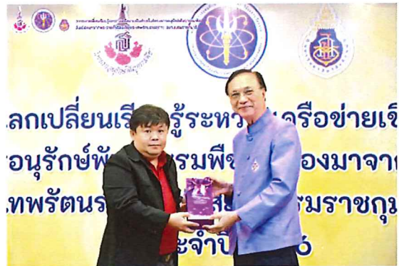
ภาพกิจกรรมที่ ๓ ตัวแทนจากมหาวิทยาลัยนเรศวร แม่ข่ายเครือข่าย ภาคเหนือตอนล่าง