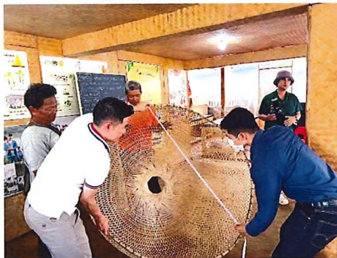
ภาพกิจกรรมที่ ๑ ชุมไม้