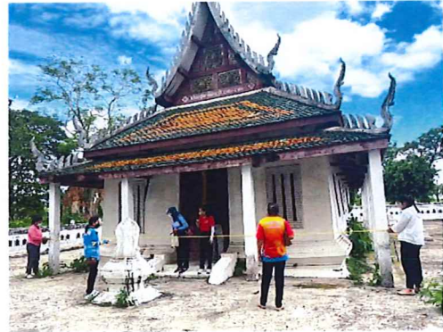
ภาพกิจกรรมที่ ๑ โบราณสถาน