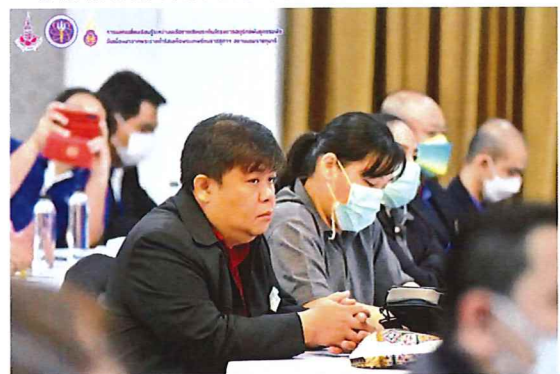
ภาพกิจกรรมที่ ๓ ตัวแทนจากเครือข่ายภาคเหนือตอนล่าง