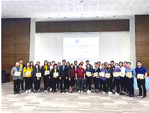
ภาพกิจกรรมที่ ๑ ตัวแทนเครือข่าย

กิจกรรมที่ ๑ : โครงการพัฒนาบุคลากรด้านการจัดทำข้อมูลฐานทรัพยากรท้องถิ่นเครือข่าย C-อพ.สธ. ระยะที่ ๓