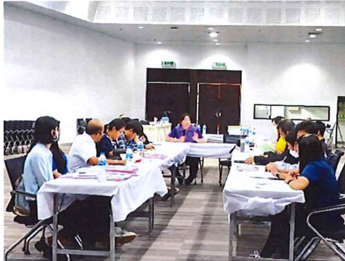
ภาพกิจกรรมที่ ๒ การประชุมเครือข่าย