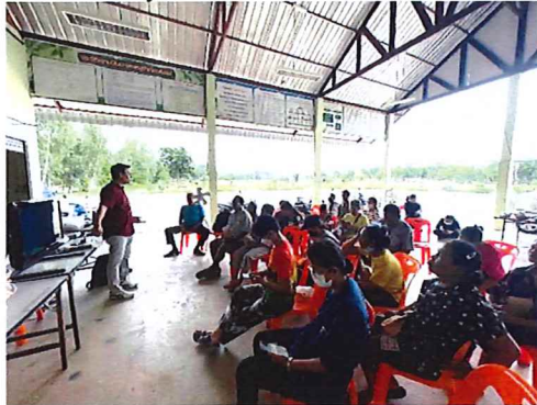
ภาพกิจกรรมที่ ๔.๒ วิทยากรบรรยายการทำกิจกรรม