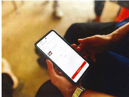
ภาพกิจกรรมที่ ๔.๒ ช่องทางการขายสินค้าชุมชน