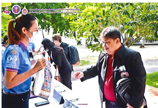
ภาพกิจกรรมที่ ๓ ตัวแทนจากมหาวิทยาลัยนเรศวร แม่ข่ายเครือข่าย ภาคเหนือตอนล่าง