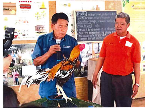
ภาพกิจกรรมที่ ๑ ไก่เหลืองหางขาว