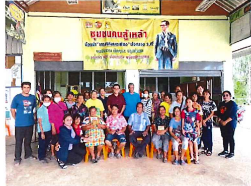
ภาพกิจกรรมที่ ๔.๒ กลุ่มผู้เข้ารับการฝึกอบรมเชิงปฏิบัติ