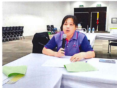
ภาพกิจกรรมที่ ๒ เครือข่ายม.นเรศวร