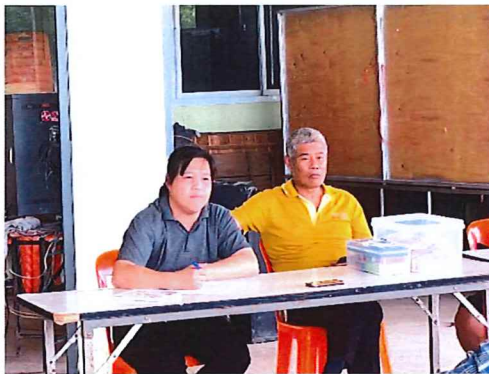
ภาพกิจกรรมที่ ๔.๑ ตัวแทนจากมหาวิทยาลัยนครสวรรค์