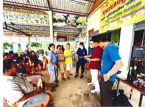
ภาพกิจกรรมที่ ๔.๒ การฝึกอบรมเชิงปฏิบัติ