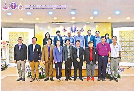
ภาพกิจกรรมที่ ๓ การแลกเปลี่ยนเรียนรู้ระหว่างเครือข่าย C-อพ.สธ.