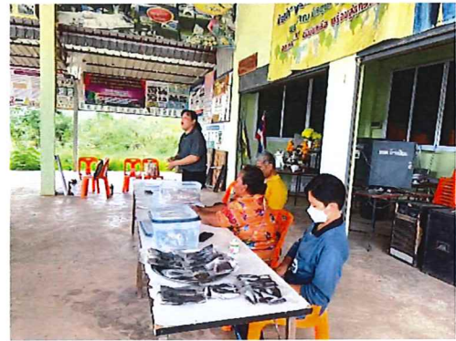
ภาพกิจกรรมที่ ๔.๑ ตัวแทนจากม.ราชภัฏพิบูลสงคราม