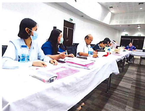
ภาพกิจกรรมที่ ๒ เครือข่ายวิทยาลัยชุมชนตาก