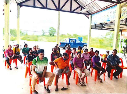
ภาพกิจกรรมที่ ๔.๑ ตัวแทนประชาชนตำบลบ้านป้อม