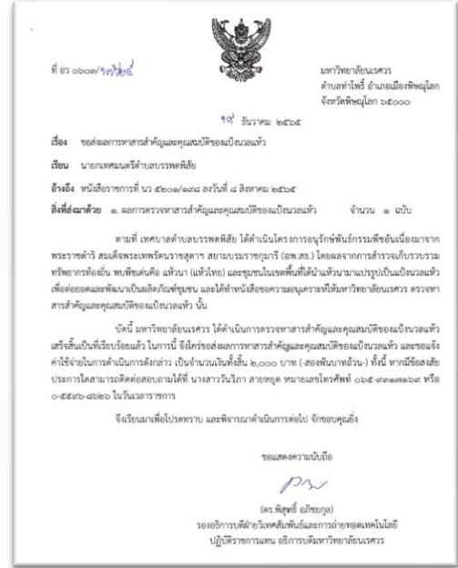
ภาพแสดงการประสานงานการตรวจหาสารสำคัญ (แบ่งนวลเหั่ว) เทศบาลบรรพตพิสัย จังหวัดนครสวรรค์