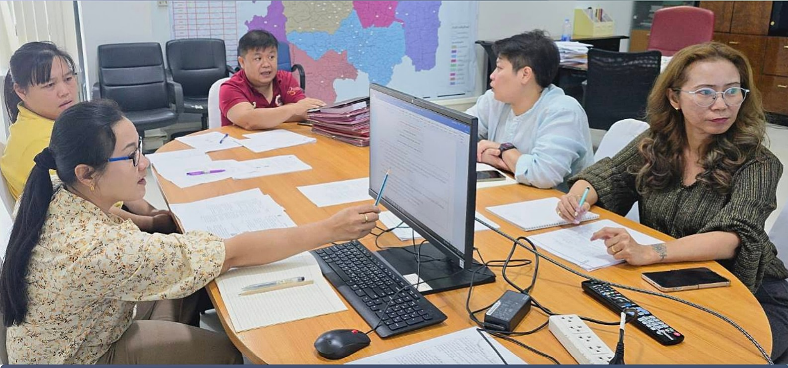
วันที่ 20 พฤษภาคม 2567 กองส่งเสริมการบริการวิชาการ โดยผู้อำนวยการกองส่งเสริมการบริการวิชาการ หัวหน้างาน และบุคลากร ประชุมทบทวนและเตรียมความพร้อมการจัดทำแผนยุทธศาสตร์กองส่งเสริมการบริการวิชาการ พ.ศ. 2568 -2570 ณ ห้องประชุมกองส่งเสริมการบริการวิชาการ